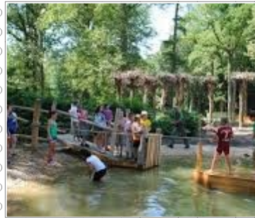
Speeltuin & openluchtmuseum Bokrijk